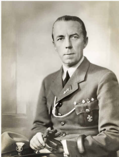
The "Prince Of Peace!" Count Folke Bernadotte Af Wisborg

Denna första Jamboree efter kriget (fredsjamboreen) fick jag och ett hundratal andra svenska scouter delta i under ledning av Folke Bernadotte.