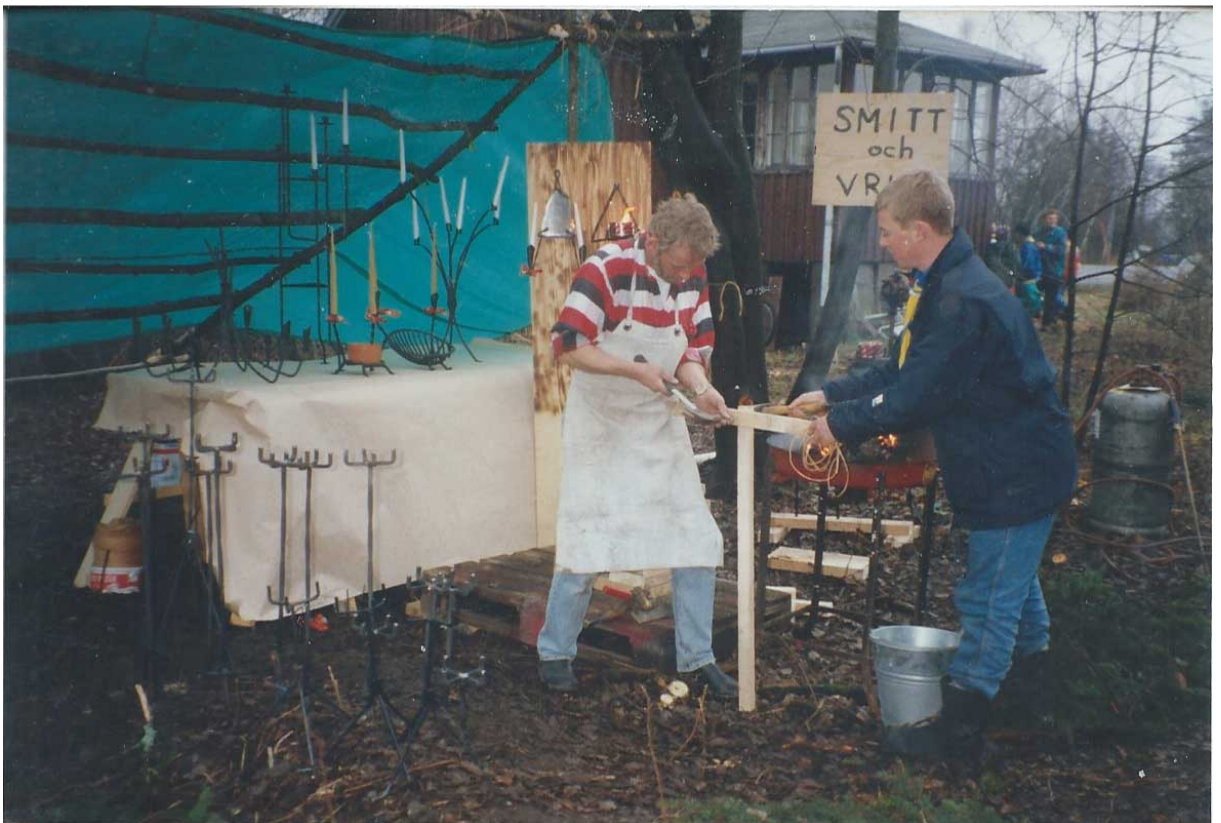
Smeden visade upp sig och sålde ljusstakar på en marknad.