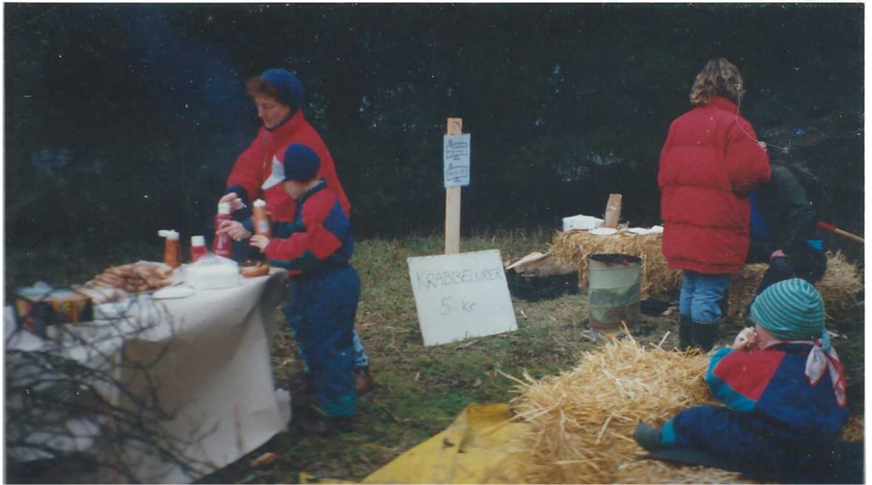
Krabbelurer var en specialitet. Varm korv är också gott.