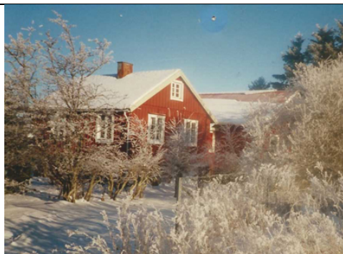
Bild på Kålekulla