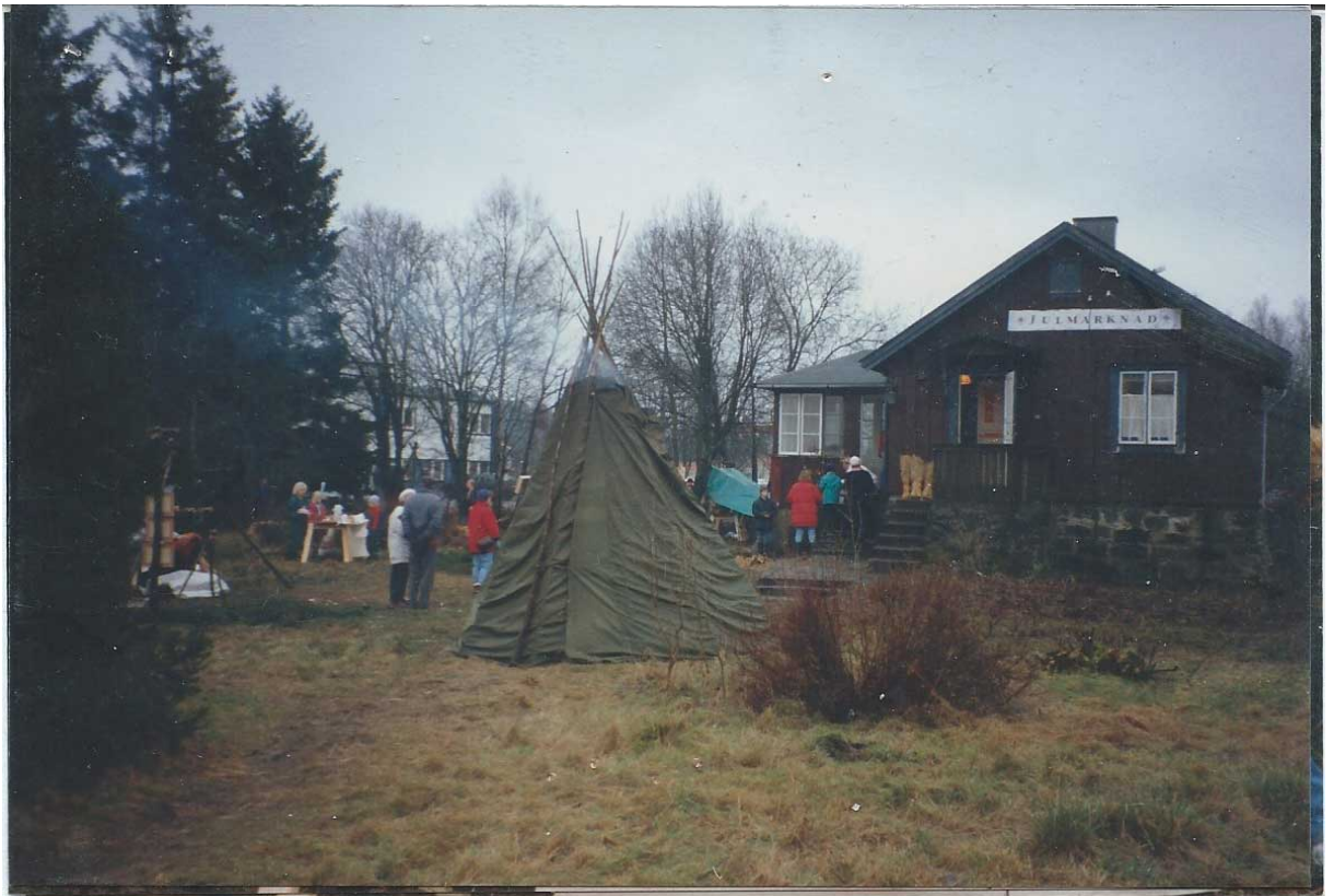
En exteriör från en julmarknad.