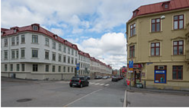
Sägatan med äldre landshövdingehusbebyggelse på båda sidorna.

Stadsdelen består till största delen av bostadskvarter men vid hamnen och dess närhet finns en del utpräglade kontors- och näringsverksamheter. Området längs hamnen är drygt hundra meter brett och avskärmas från resten av Majorna genom Oscarsleden . Området mellan Oscarsleden och älven utgör på så sätt ett sammanhängande område längs hela södra älvstranden som har mer gemensamt med hamnen än med Majorna. Från öster ligger först Masthuggskajen med Stena Lines Danmarksterminal, Stigbergskajen varifrån Amerikabåtarna avgick förr, Göteborgs fiskhamn , Majnabbehallen med Stena Line:s Tysklandsterminal och sedan Klippan .