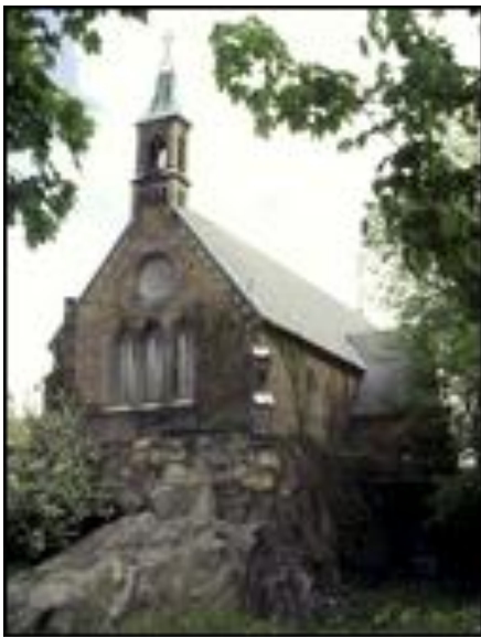
S:ta Birgittas Kapell