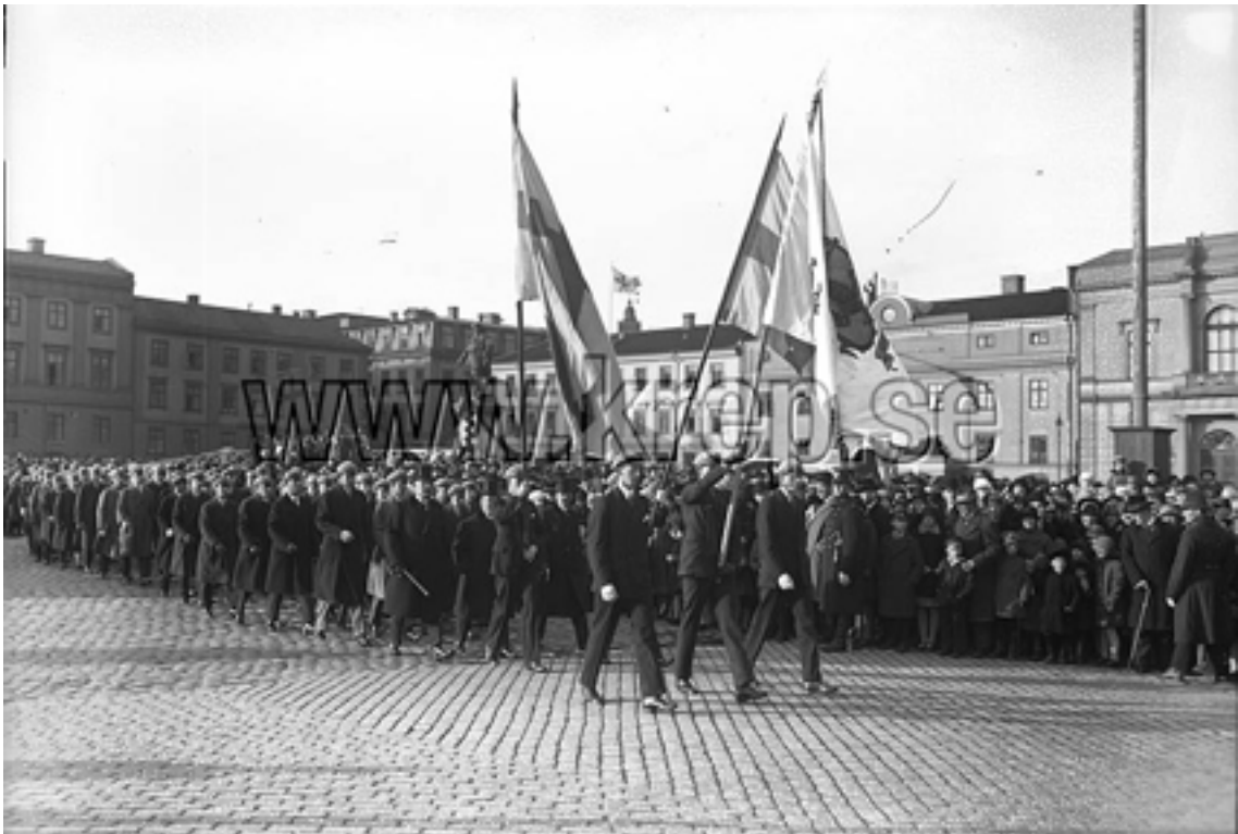
Gustav Adolfsdagen firas 6 november 1927

Här ett äldre foto av en GustavAdolfsmarsch, som just anlant till Gustav Adolfs torg där ju Hans Majestät, Göteborgs grundare, stod stat.