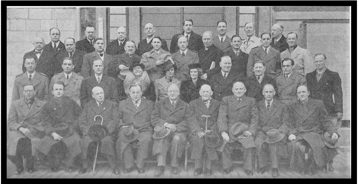
Lärarna 1941. Och Här lärarkollegiet 1945.