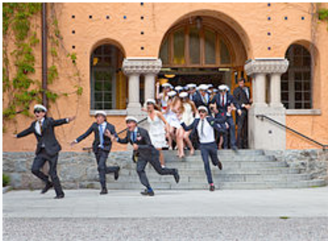
Glada studenter firar sin avslutade skoltid med "studentutspringet". Viktor Rydbergs Gymnasium 2010

Då avlagd studentexamen innebar att man fick behörighet till studier vid universitet eller högskola , kunde man kallas student så snart man hade "tagit studenten". Det var vanligt att en person med studentexamen, men som ännu inte hade påbörjat universitetsstudier, titulerades "kandidaten".