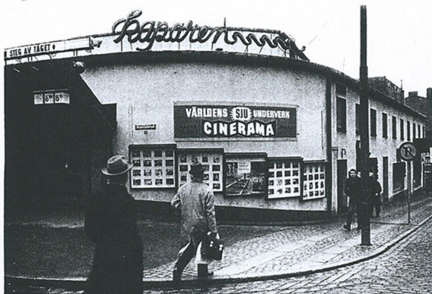
Kaparen på Stigbergstorget. Cineramafilmen "Världens Sju underverk" hade premiär på Draken i december 1960.

tungviktare. Båda belägna på Stigbergstorget. Kaparen var först och invigdes den 24 februari 1940. Med sina 801 platser och den första skidbackparketten var biografen långt före sin tid. Man såg bra på alla platser eftersom det inte fanns någon balkong utan endast en rymlig parkett.