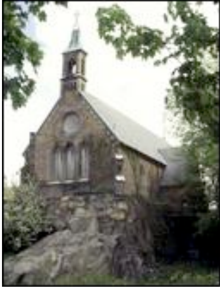
S:ta Birgittas Kapell