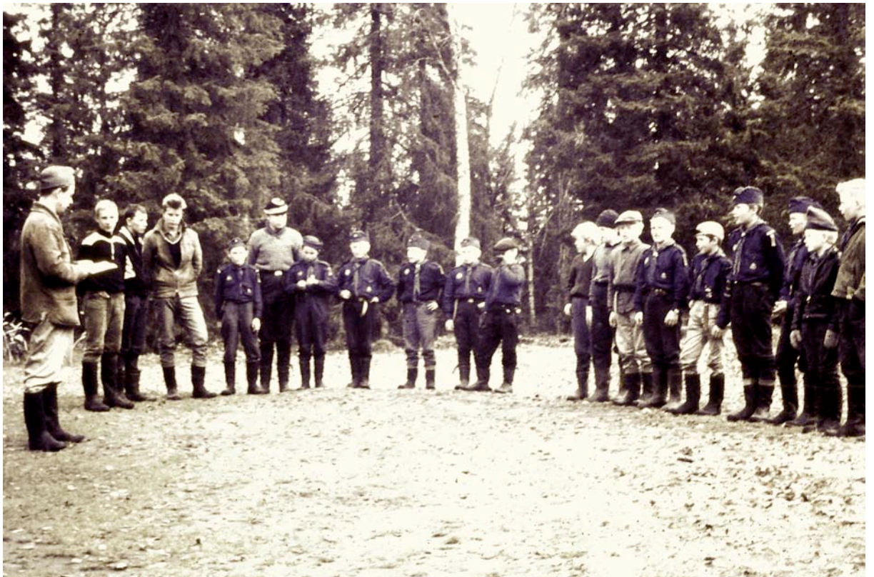
Också här friluftsliv.