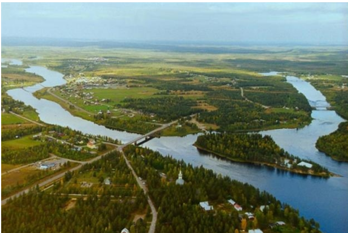
Men ibland tråkigare vyer. Hormonbehandlad skog.