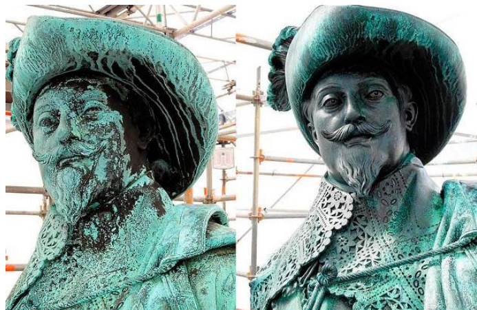
Göteborgs Gustav II Adolf före och efter renoveringen.

”Framåt klockan elfva böljade folkströmmen dit från alla håll. Alla i staden varande trupper hade der bildat fyrkant, med Vestgöta regemente i midten, ty detta regemente skulle i dag af kronprinsen erhålla nya fanor.”-