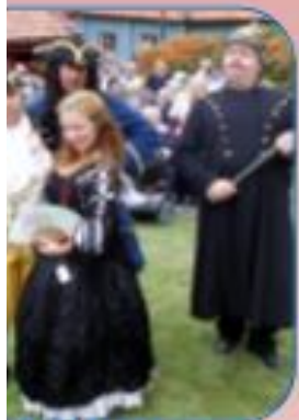
Öst Reservatets historiska personer.

Majorna förknippas ofta med kulturliv och pubar – och inte utan anledning! Stadsdelen har en gedigen lokalhistoria med alkohol som en omistlig del. Vi fördjupar vi oss i Majornas alkoholhistoria: Var låg krogarna och