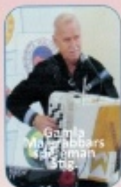
Gamla Majgrabbar Spelmän lag.