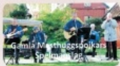
Gamla Masthuggspojkars Spelmän lag.

Gamla Masthuggspojkar och Gamla Masthuggsflickor Gamla Majgrabbar och Gamla Majtöser Vi från Vega, Gamla Majpojkers förbund och Wänskapsförbundet i samarbete med