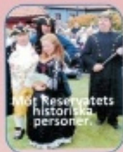
Möt Reservatets historiska personer.