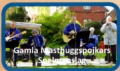
Gamla Masthuggspojkars Spelmanslag