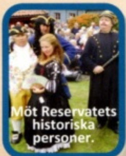
Möt Reservatets historiska personer.

Allmänna Vägen/Pölgatan vid Stigbergstorget söndagen den 6 september Kl. 12.00—15.00