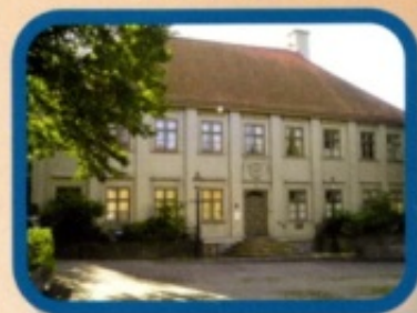
Nytt för i år.

Hjärtligt välkomna till en dag med öppet hus i samtliga föreningsstugor och i Gathenhiemska huset Kaffeservering - Lotteriförsäljning Försäljning av föreningsars årstidningar. Föreningarnas spelmän underhåller.