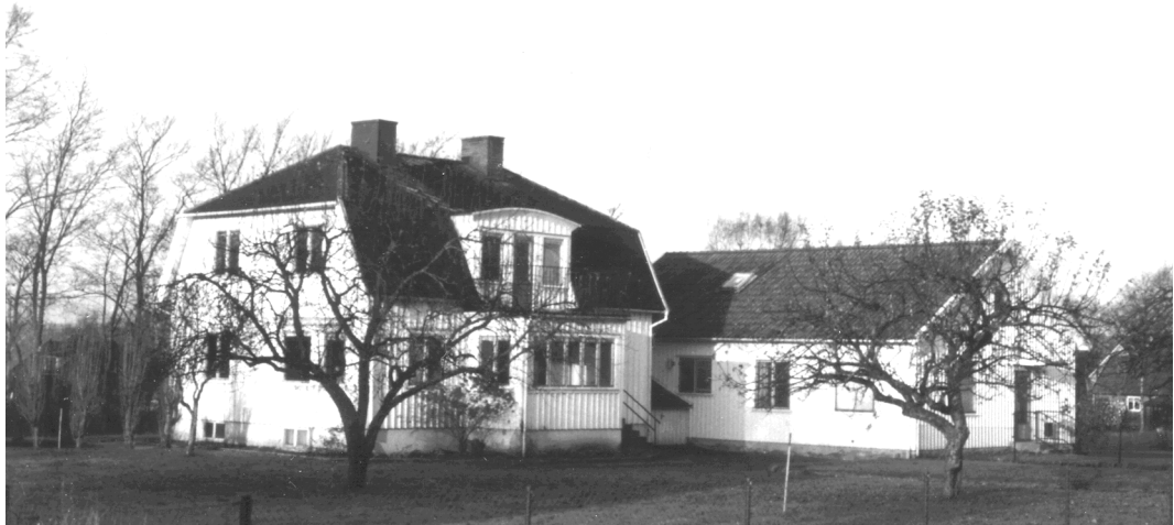
Läkarbostad och mottagning i Gråbo på 1960-talet

Vår tjänstebostad i Gråbo var av samma typ som i Korpilombolo men äldre. Vi tyckte efter några år i den att det skulle vara skönt med något eget så vi planerade och byggde en villa på Brännetvägen 19. Den var inflyttningsklar till jul 1969. En underbar villa där barnen växte upp med egna rum. Men vi blev äldre och barnen flyttade ut. Dags att fundera på ett mindre och mer lättskött boende.